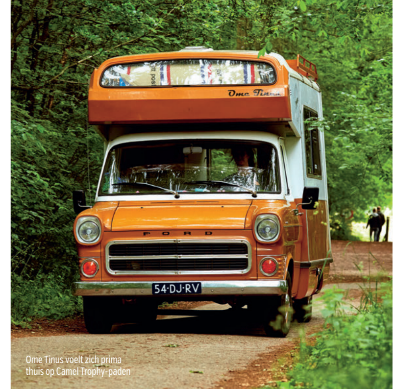
Ome Tinus voelt zich prima thuis op Camel Trophy-paden

Wie de kruidenierswinkel binnenstapt, reist zo'n zestig jaar terug in de tijd