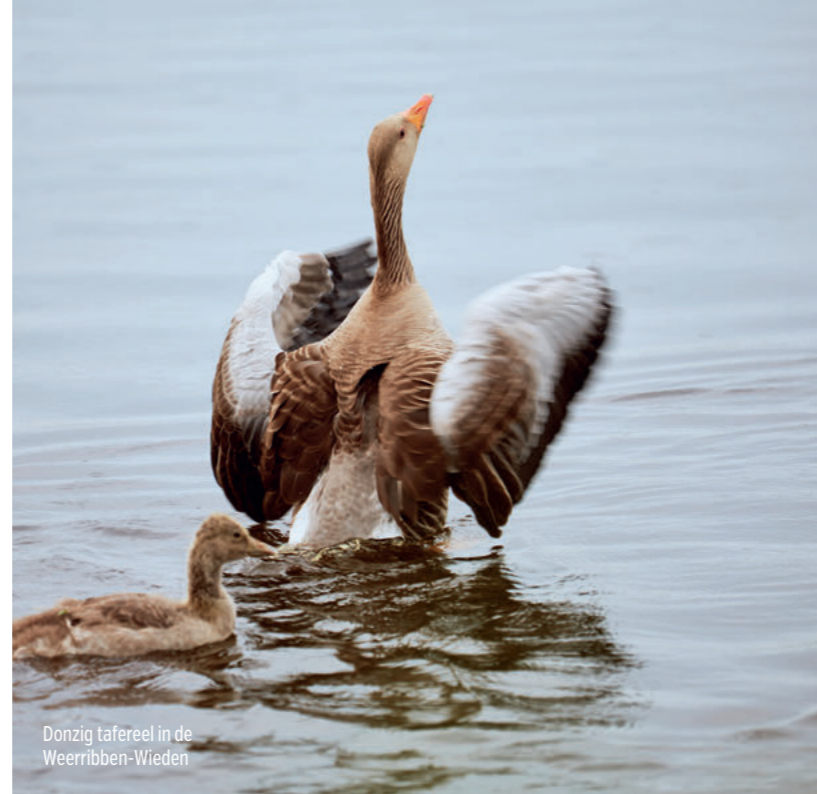
Donzig tafereel in de Weerribben-Wieden