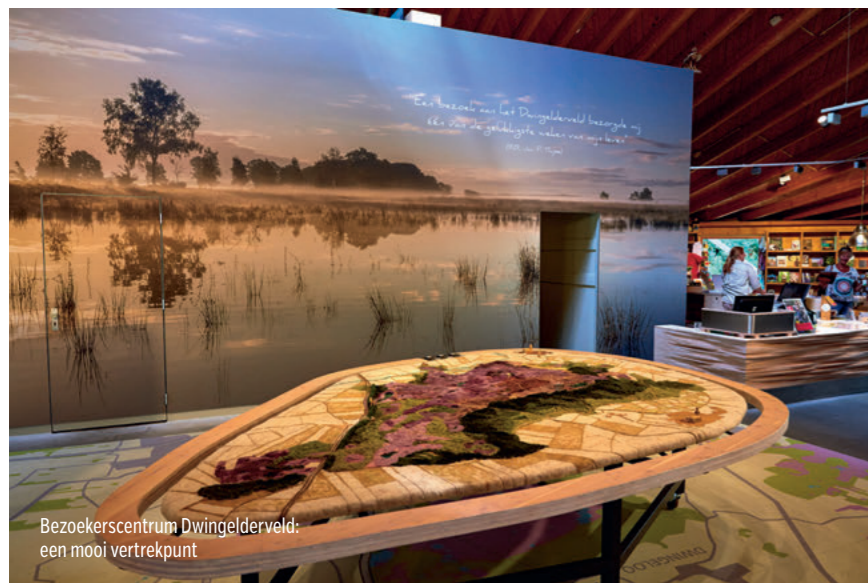
Bezoekerscentrum Dwingelderveld: een mooi vertrekpunt

Bezoekerscentrum Dwingelderveld is het ideale vertrekpunt om het grootste en vochtigste heidegebied van West-Europa te ontdekken. Geflankeerd door jeneverbesstruwelen en tientallen schitterende vennen voeren fiets- en wandelpaden je over de heide en door het bos. Links en rechts grazen Drentse heideschape; kijk, één diersoort van The Big Five van het Dwingelderveld kunnen we al van ons lijstje afstrepen. Water is hier nooit ver weg: de plassen in dit gebied zijn een paradijs voor vlinders en reptielen. Wie heel stil is, kan een ringslang of adder zien weg stuiven in het water of hoort de unieke roep van de kraanvogel.