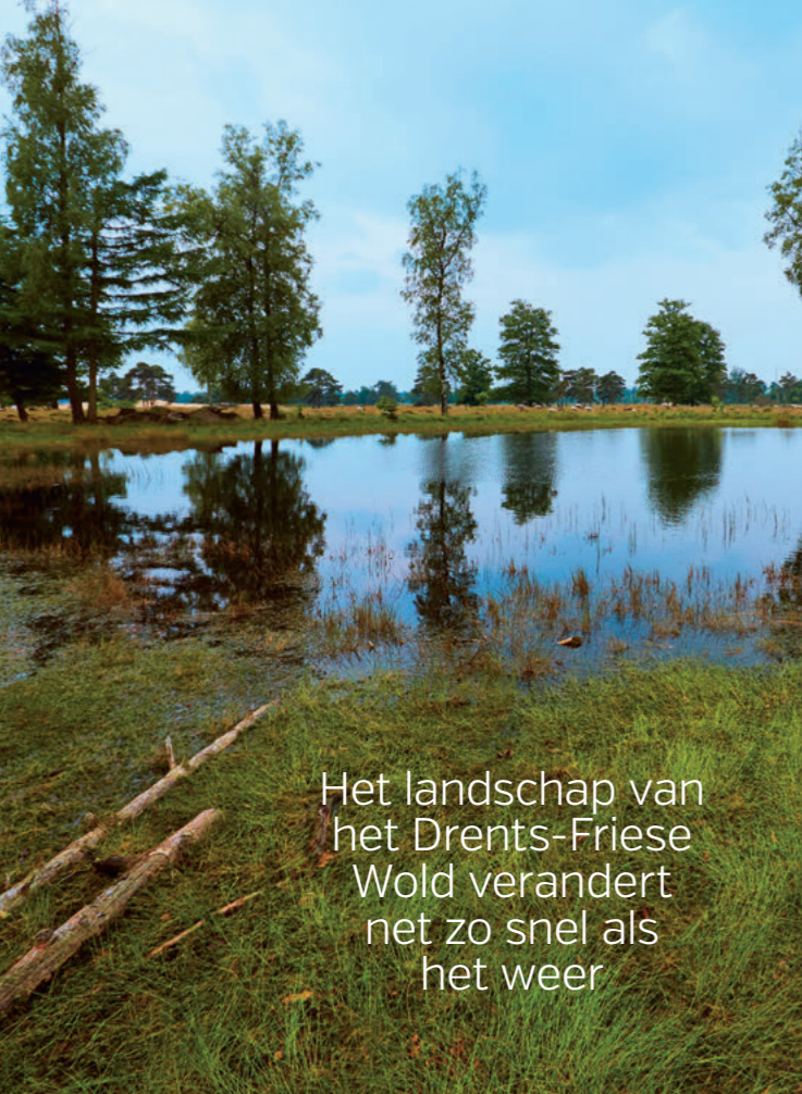
Het landschap van het Drents-Friese Wold verandert net zo snel als het weer