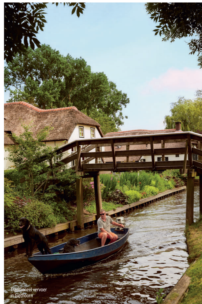
Traditioneel vervoer in Giethoorn