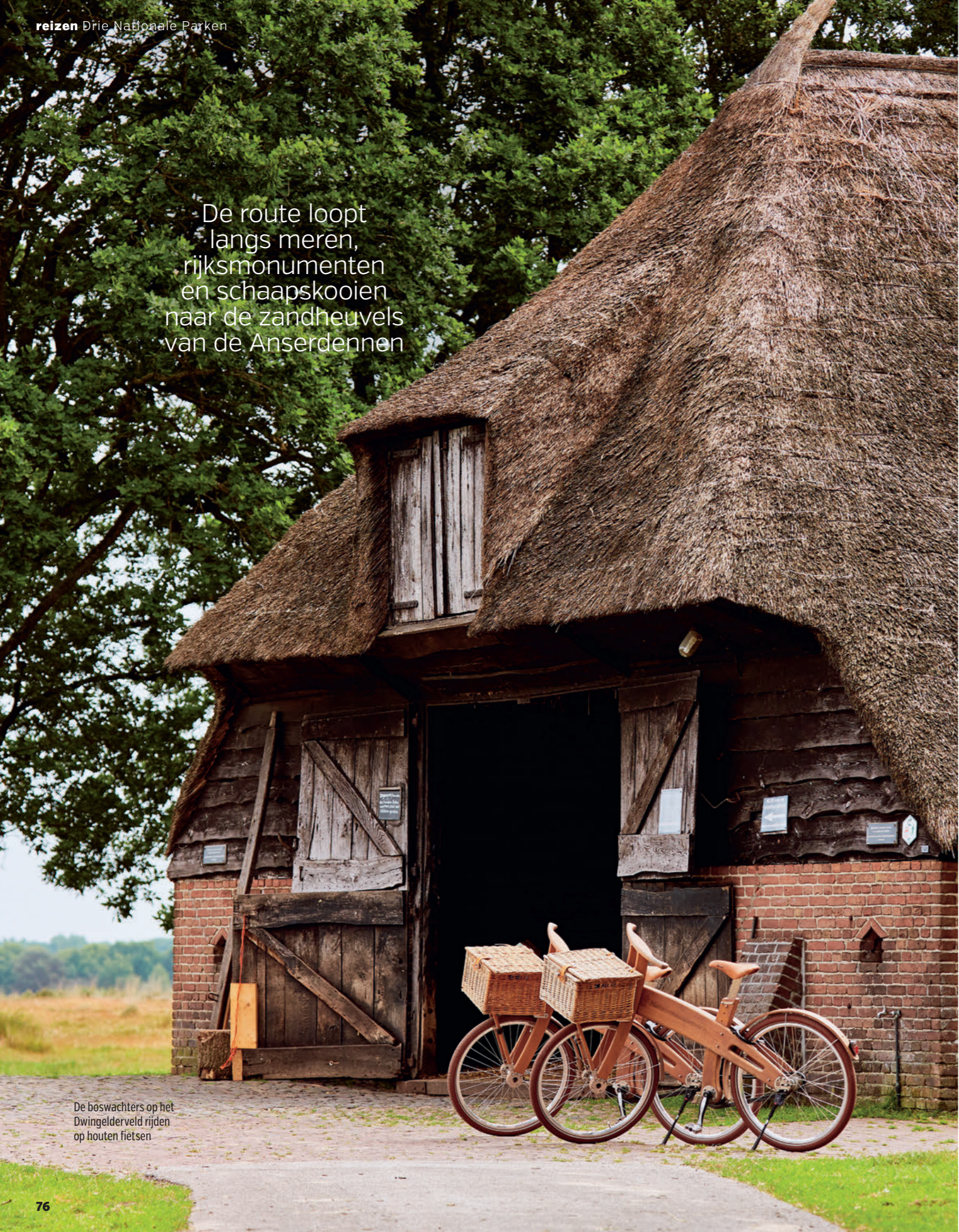
De boswachters op het Dwingelderveld rijden op houten fietsen

De route loopt langs meren, rijksmonumenten en schaapskooien naar de zandheuvels van de Anserdennen